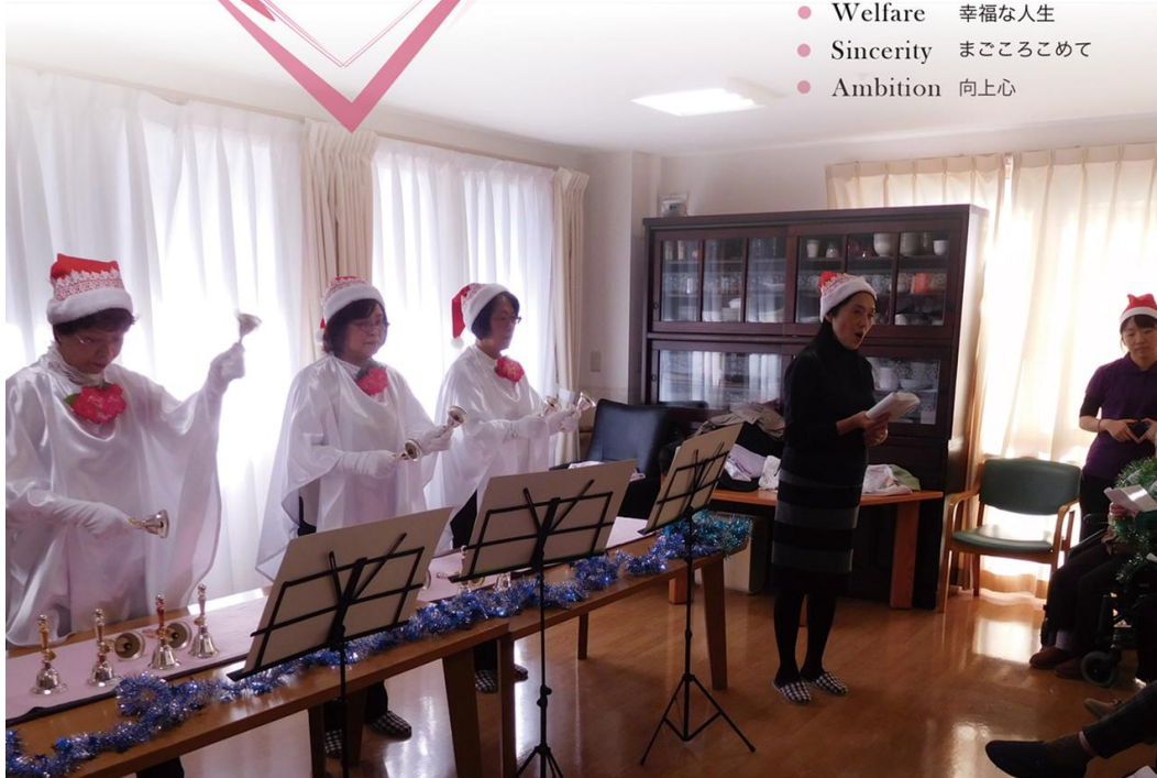
12月22日にハンドベルのボランティアの方が来てくださいました。(デイサービスふれあい段原にて)