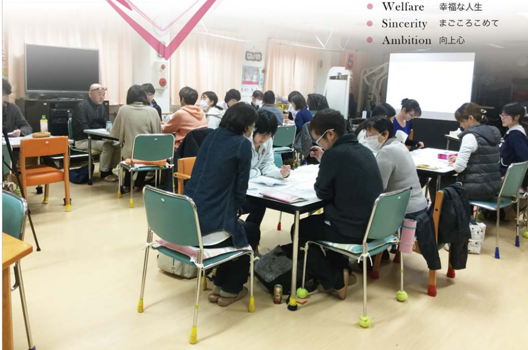
写真・・・3月18日「ターミナルについて」研修の様子