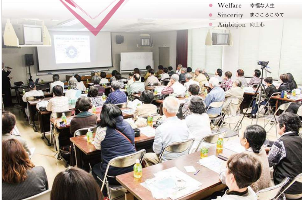
4月23日(土) 第8回「春の健康講演会」の様子