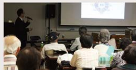
西村先生『人生をよりよく生きる精神科学』