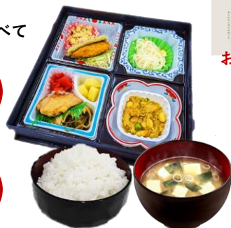
株式会社ランチセンター様