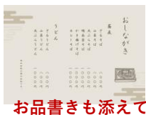
お品書きも添えて