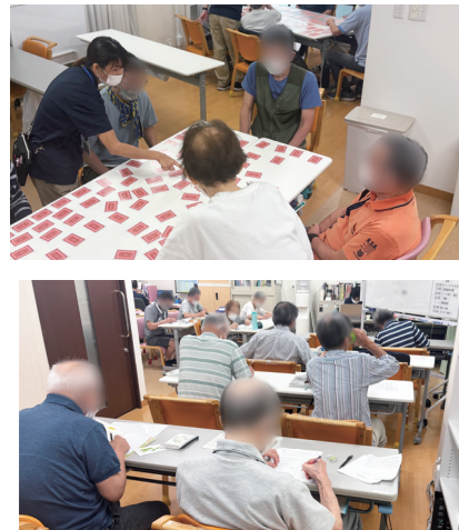
▶ 集団リハビリ・訓練プログラムの様子

◆高次脳機能障害とは 交通事故や脳卒中、脳腫瘍などで脳が損傷を受け、日常生活や社会生活への適応が難しくなる状態です。症状は人により異なりますが、記憶障害や集中力の低下、感情の不安定、計画力の低下などが見られることがあります。